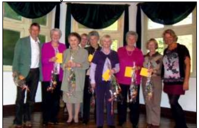
Auf dem Bild sehen wir die Gruppenleitung und die geehrten Jubilare.

Die SHG Solingen feierte ihr 20-jähriges Bestehen Gründungsdatum 1. November 1993