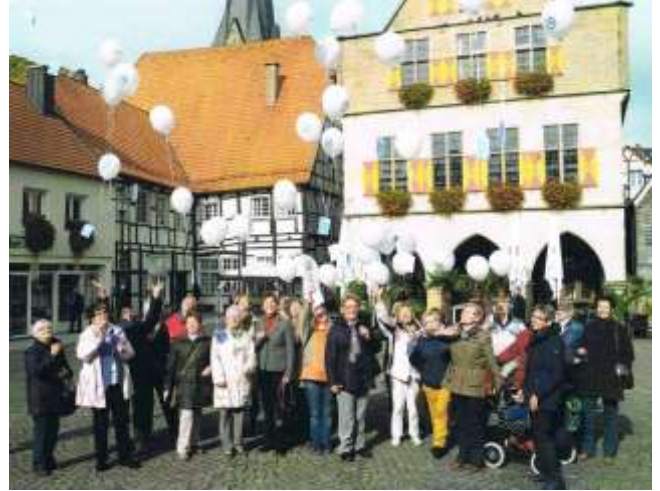
Hier sehen wir die Akteure beim Start der OSTEOPOROSE-Luftballone.

den Finder zurückgeschickt werden. Unter den Findern der Ballone, die die weiteste Strecke zurückgelegt haben, werden kleine Belohnungen ausgelost. Zwei örtliche Tageszeitungen haben über diese Aktion berichtet