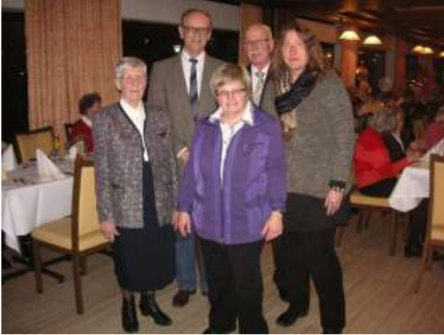
25 Jahre Osteoporose SHG Bielefeld