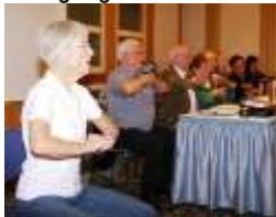
Bild 3: Bewegung zur Auflockerung